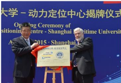
“上海海事大学-动力定位中心”揭牌

2015 年 2 月 9 日，开办了首期 DP 知识普及课程，包括德国、意大利、韩国，和中国上海、广州、大连等地的 9 名学员参加了培训；2015 年 3 月 19-20 日，顺利通过英国航海学会对中心的培训授权认证