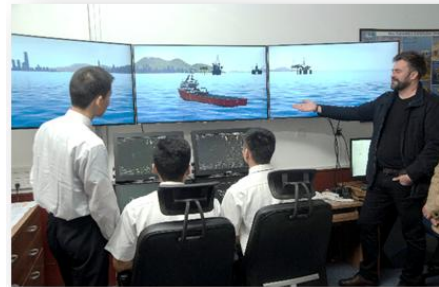
动力定位 3D 影像模拟器

2015 年 2 月 9 日，开办了首期 DP 知识普及课程，包括德国、意大利、韩国，和中国上海、广州、大连等地的 9 名学员参加了培训；2015 年 3 月 19-20 日，顺利通过英国航海学会对中心的培训授权认证